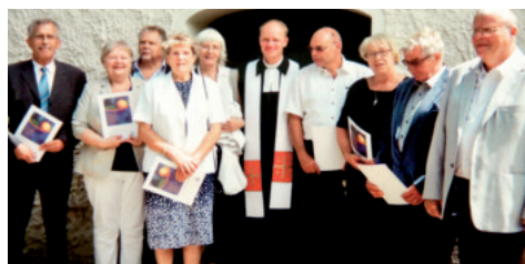
Die Jubelkonfirmanden von 2016